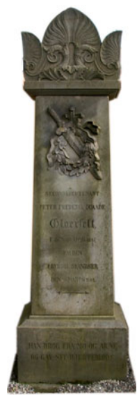
HAN DROG FRA MØ OG ARNE OG GAV SIT HJERTEBLOD