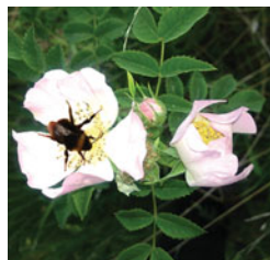
"Bien og blomsten".

Mange forældre til piger drog da også et lettelsens suk, da p-pillen i 1966 blev indført, så alle kunne købe dem i samråd med deres læge.